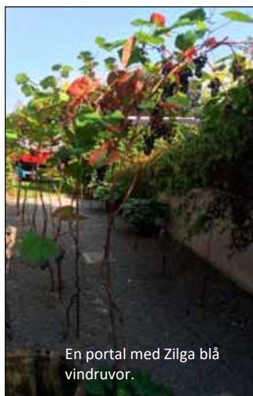
En portal med Zilga blå vindruvor.