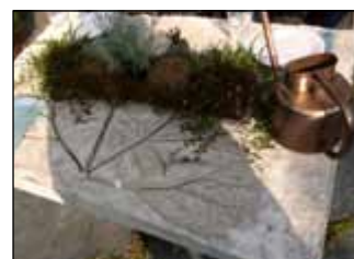
Många små fina och kluriga detaljer överallt, egenhändigt gjutna betongbord, små rostiga figurer, behållare med växter...

Växthuset har underbart högt i tak, 3,6 meter, och två av väggarna består av tegel. Tänk att slippa kapa tomaterna på höjden... De vackra fönstren är återvunna från ett nedlagt sjukhus.